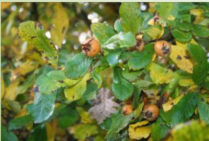
Néflier (O. Duval)

Les magnifiques alignements d'arbres au niveau des haies et leur conservation dans les parties boisées témoignent de la qualité de l'environnement et de la volonté du propriétaire à valoriser ce patrimoine naturel.