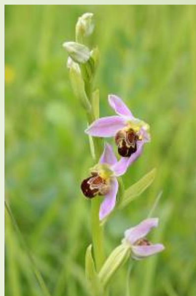
Ophrys abeille (A. Mottier)

Au printemps, deux orchidées, l'Ophrys abeille et l'Orchis bouc, fleurissent en abondance. De nombreux papillons sont aussi présents, ainsi que tout un cortège d'insectes de zone humide et de prairie. Depuis 2010, plus de la moitié des espèces de papillons connus en Mayenne ont été observées sur le site (32 espèces).