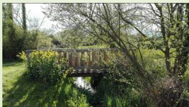
Passerelle (A. Mottier)

Des panneaux pédagogiques sur le ruisseau et son environnement ont été réalisés par les enfants de l'école publique. Une passerelle a été installée par le Syndicat de Bassin de la Vaige.