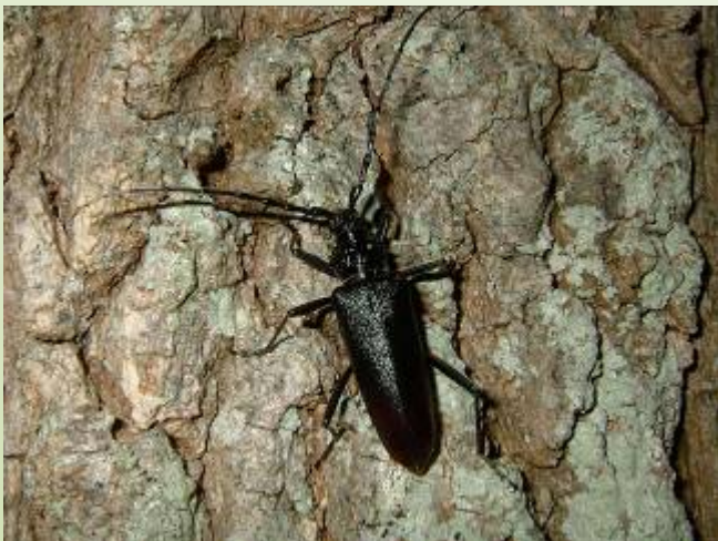
Grand-capricorne (O. Duval)