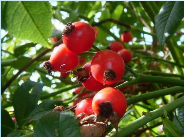
Cynorrhodon de l'Eglantier (O. Duval)

Le chemin offre la possibilité d'observer le paysage avec un dénivelé de 30 m au-dessus du village. Un linéaire de haies a été planté par les élèves des écoles communales dans les années 1980 (toujours visible aujourd'hui au niveau du hameau de « Bel Air »). Le circuit est un chemin de randonnée balisé.