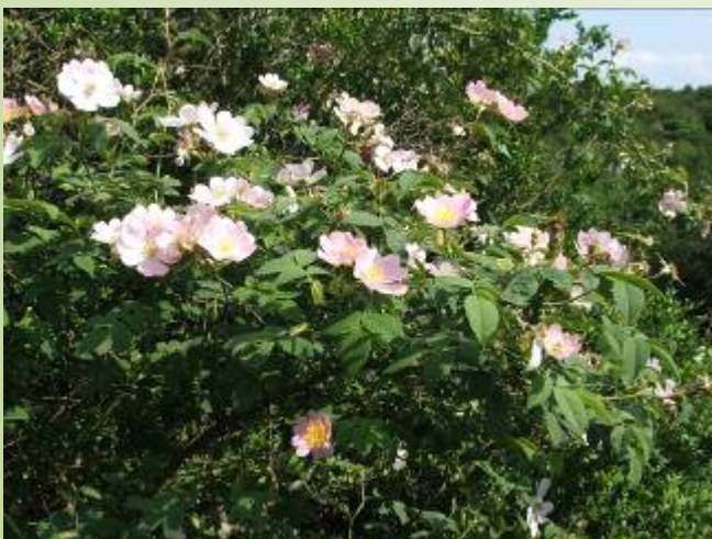
Églantier (M. Ravet)

Au printemps, le paysage offre une belle perspective sur le bocage environnant. Le visiteur pourra admirer les talus fleuris égayés par le chant des oiseaux et l'activité des insectes butineurs. Une espèce protégée d'insecte, le Grand-capricorne, se cache dans les troncs des chênes.