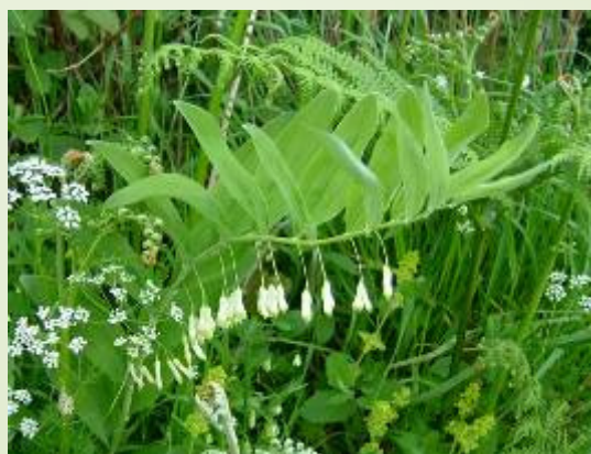
Sceau-de-Salomon (O. Duval)