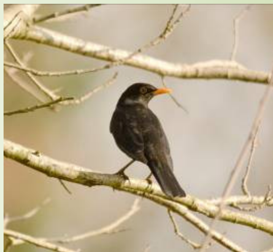
Merle noir (L. Herriau)

Des panneaux pédagogiques sont disposés le long du parcours sur les arbres, la vie de la haie, le rôle du bois mort ou du lierre. Les écoles, l'accueil de loisirs, ainsi que les randonneurs fréquentent les lieux.