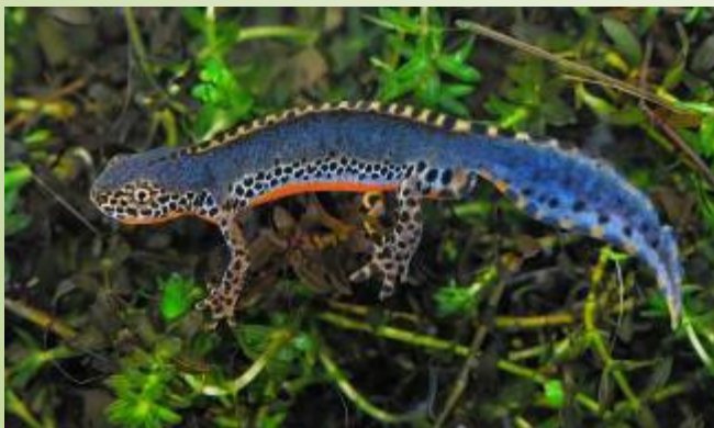
Triton alpestre (B. Baudin)