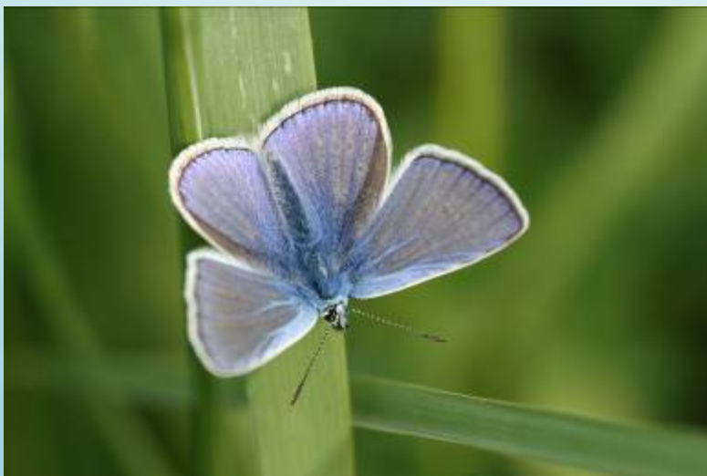
Azuré commun (O. Duval)