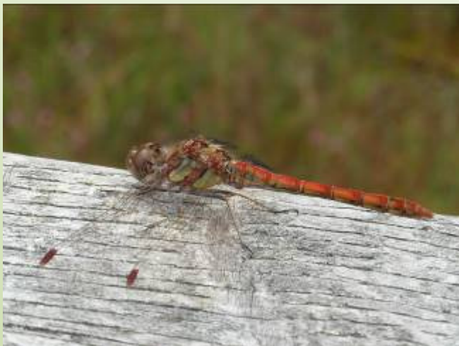
Sympétrum strié (O. Duval)