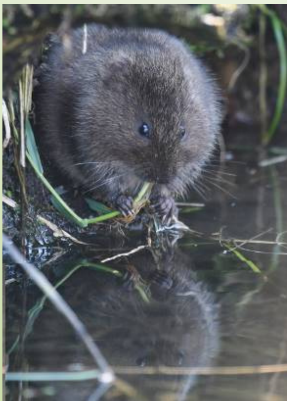
Campagnol amphibie (V. Fuchs)