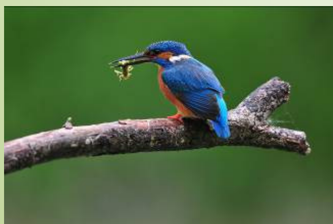
Martin pêcheur (R. Peillon)