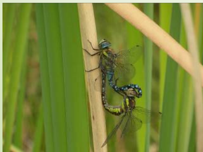
Aeshne mixte (O. Duval)