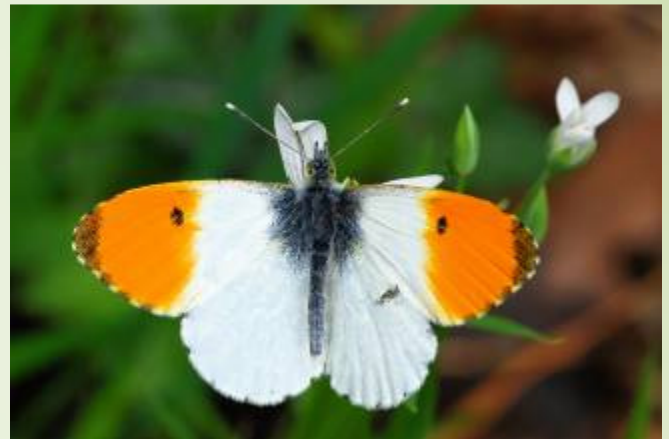
Aurore (B. Baudin)

Une balade bucolique au printemps et en été est idéale pour observer les oiseaux du bocage et admirer les papillons au pied des talus, ainsi que les habitants du plan d'eau.