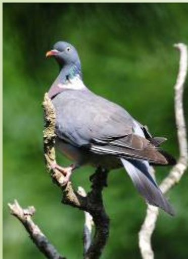
Pigeon ramier (R. Peillon)