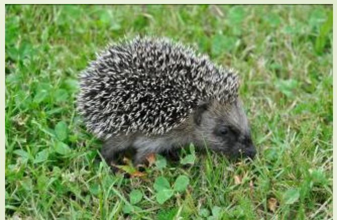
Hérisson (J.-P. Helbert)

Vous trouverez d'autres informations sur le site internet de MNE http://www.mayennatureenvironnement.fr/le-reseau.html .