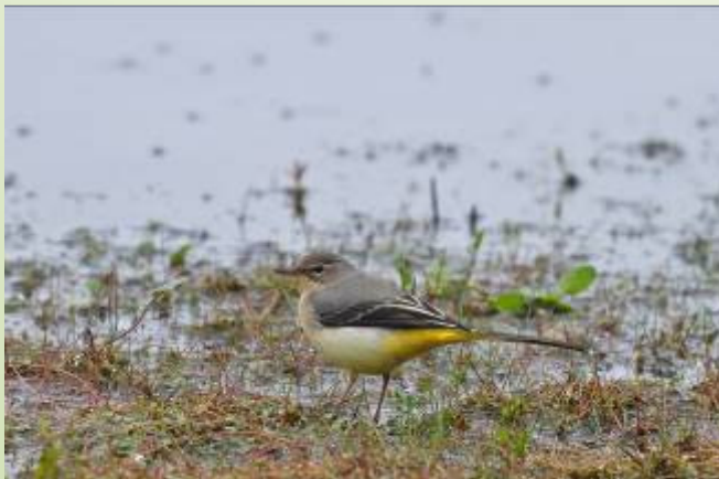
Bergeronnette des ruisseaux (R. Peillon)