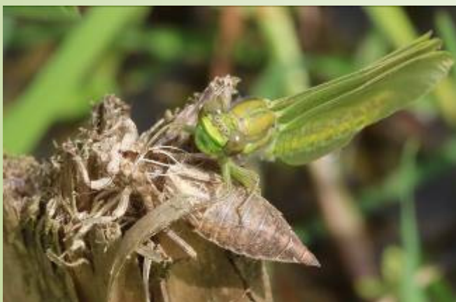
Gomphe gentil