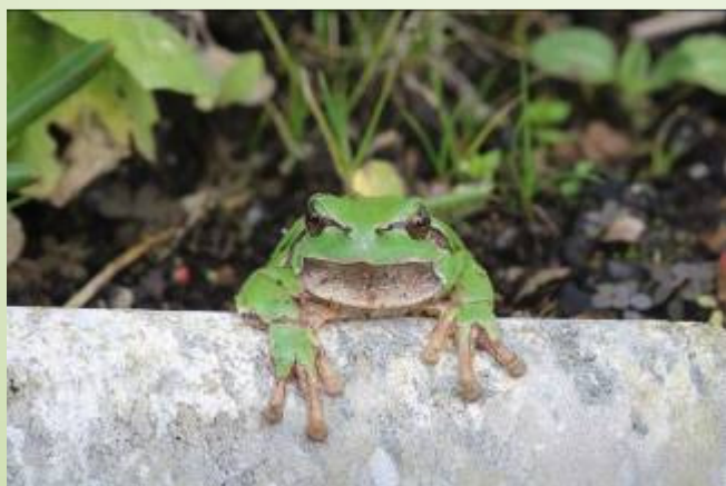
Rainette (O. Duval)