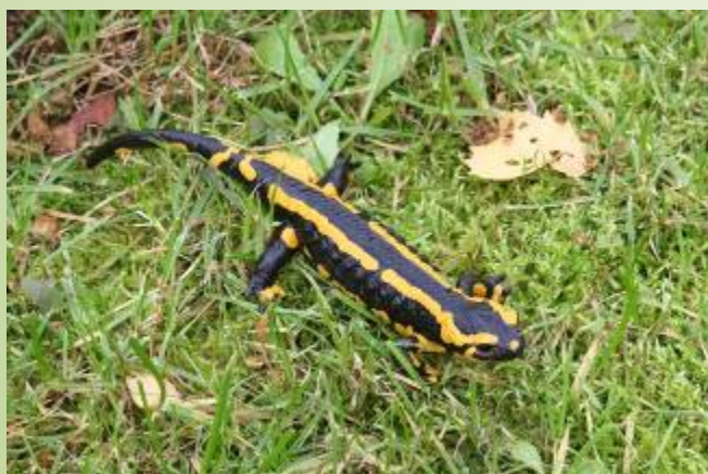
Salamandre (O. Duval)