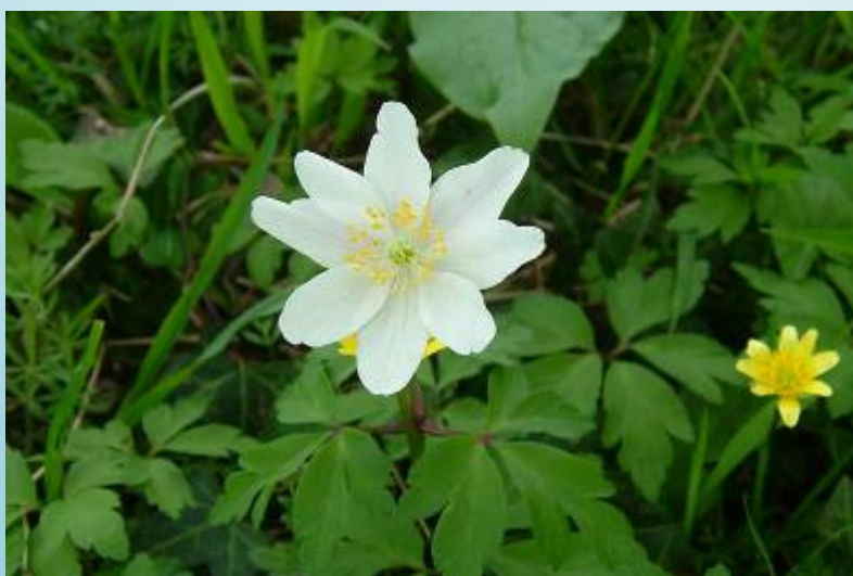
Anémone des bois (O. Duval)