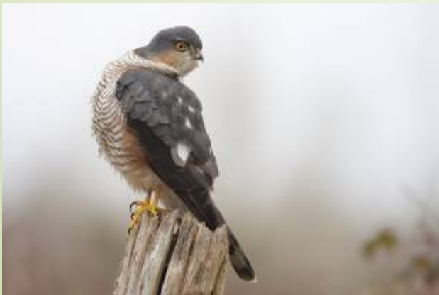
Épervier d'Europe (P. Houalet)