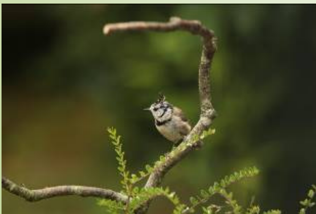
Mésange huppée (B. Foulard)