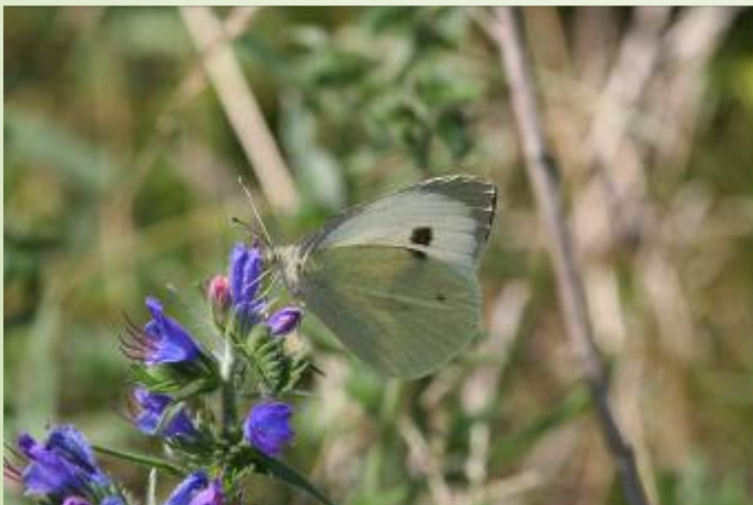
Piéride du Chou (O. Duval)