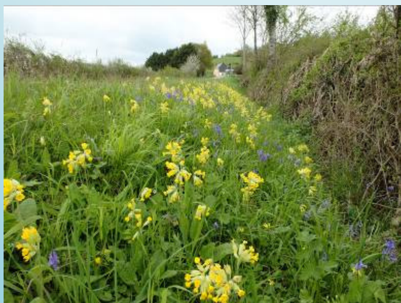
Primevère officinale (B. Jarri)

Longue de plusieurs centaines de mètres, une voûte arborée plonge le visiteur dans une ambiance fraîche.