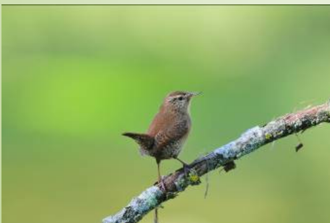
Troglodyte (R. Peillon)

En automne, de nombreux oiseaux se nourrissent des fruits des arbres et des arbustes. Les libellules, au printemps, viennent chasser des proies le long des haies. Les papillons, dont le rare Thècle du Bouleau, qui explorent les fleurs sur les tronçons ensoleillés du chemin.