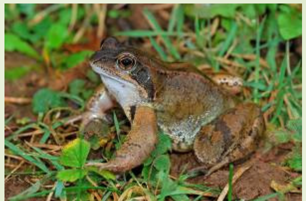
Grenouille rousse (B. Baudin)

Vous trouverez d'autres informations sur le site internet de MNE http://www.mayennatureenvironnement.fr/le-reseau.html .