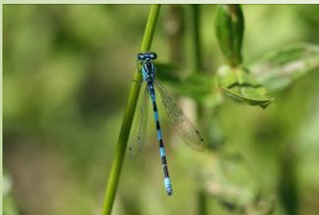
Agrion de Mercure (O. Duval)