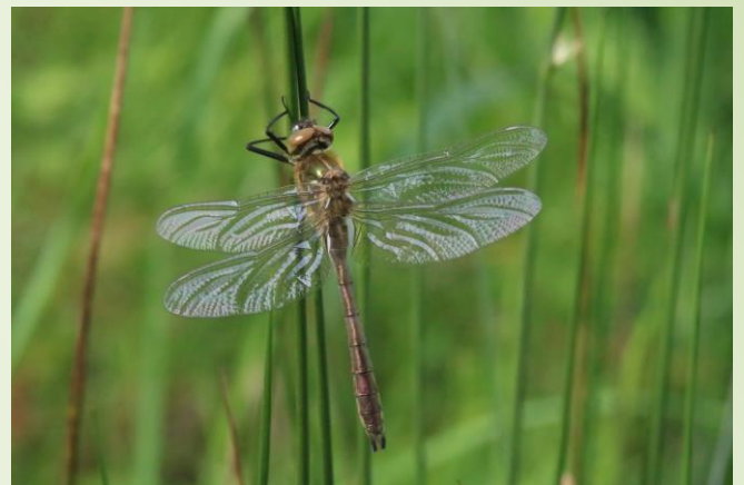
Emergence Cordulie bronzée (O. Duval)

Le site compte 187 espèces de plantes dont 3 à valeur patrimoniale en Pays-de-la-Loire : la Corrigiole des grèves, le Myosotis des bois et le Scirpe des bois. La faune est représentée par 3 espèces d'amphibiens (grenouilles verte et agile, Triton palmé – protégé au niveau national), 20 espèces de libellules dont la Cordulie bronzée, la Naiade aux yeux rouges et l'Agrion mignon (espèces patrimoniales), 19 espèces de papillons dont le Flambé, 35 espèces d'oiseaux (Pic épeiche, fauvettes, grives, Faucon crécerelle) et 6 espèces de mammifères. Le printemps et l'été sont les périodes les plus favorables à l'observation de cette biodiversité.