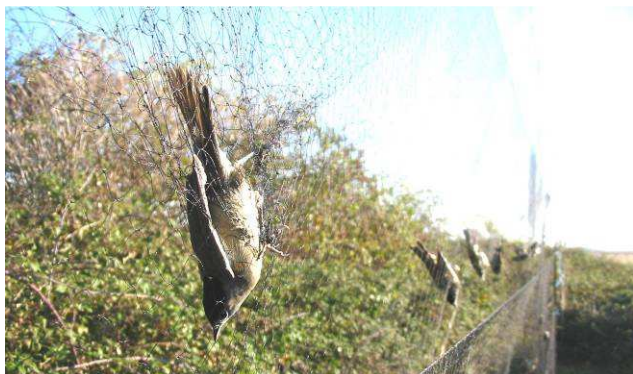
Passereaux pris au filet vertical.

Depuis l'été 2011, un programme d'étude des passereaux migrateurs par le baguage a été lancé sur le site de la Butte de Montaigu à Hambers. (Captures avec filets verticaux, mesures et relâchers des oiseaux). Cette étude d'une durée de 3 années est un partenariat scientifique entre MNE et le Muséum National d'Histoire Naturelle de Paris.