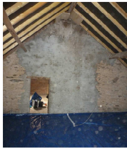
Pose de bache (St-Aignan-de-Couptrain)