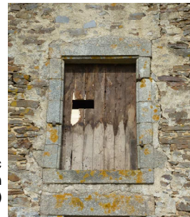
Porte avec accès de plein vol (Olivet)

L'objectif du week-end, qui s'est déroulé les 2 et 3 mars 2013, était d'effectuer des aménagements et du nettoyage de gîtes de mises-bas des chiroptères grâce à l'aide de bénévoles. Les travaux réalisés étaient pour la plupart liés à la signature des conventions avec des particuliers en faveur de la protection des chauves-souris. En effet, il est souvent nécessaire de proposer de petits aménagements afin de favoriser l'entente entre les hommes et les chauves-souris. Deux équipes de 4 personnes se sont donc réparties sur le nord et le sud du département.