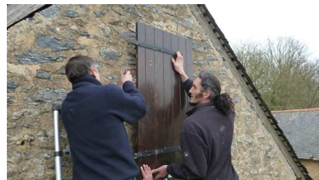
Pose d'un volet à Barbastelle sur façade de dépendance (La Cropte)

L'objectif du week-end, qui s'est déroulé les 2 et 3 mars 2013, était d'effectuer des aménagements et du nettoyage de gîtes de mises-bas des chiroptères grâce à l'aide de bénévoles. Les travaux réalisés étaient pour la plupart liés à la signature des conventions avec des particuliers en faveur de la protection des chauves-souris. En effet, il est souvent nécessaire de proposer de petits aménagements afin de favoriser l'entente entre les hommes et les chauves-souris. Deux équipes de 4 personnes se sont donc réparties sur le nord et le sud du département.