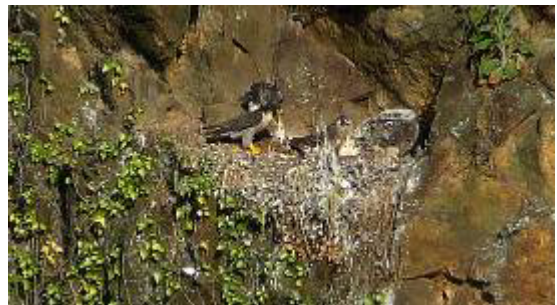
Photo prise avec une longue vue

A Saint-Pierre-la-Cour, MNE a proposé au cimentier Lafarge la pose d'un nichoir pour cette espèce espérant ainsi favoriser l'installation d'un nouveau couple. Cette demande a été acceptée. Installation prévue en 2016.