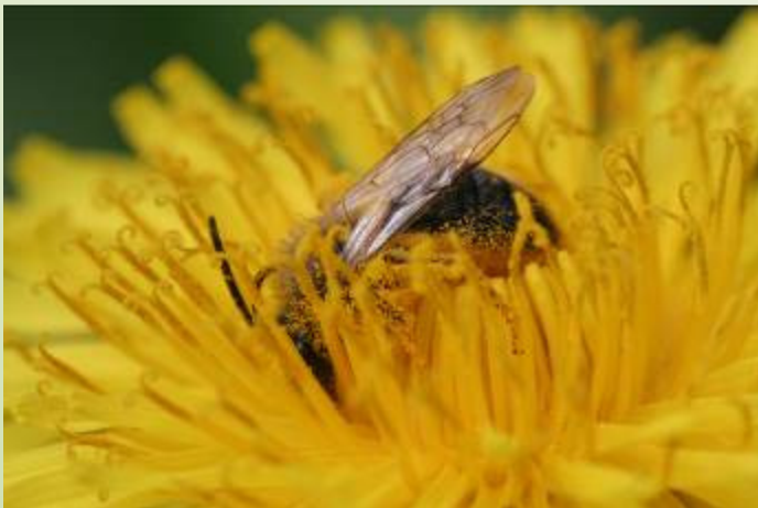
Abeille mellifère (O. Duval)