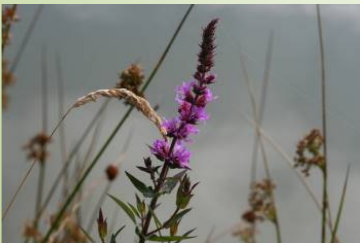
Salicaria (O. Duval)