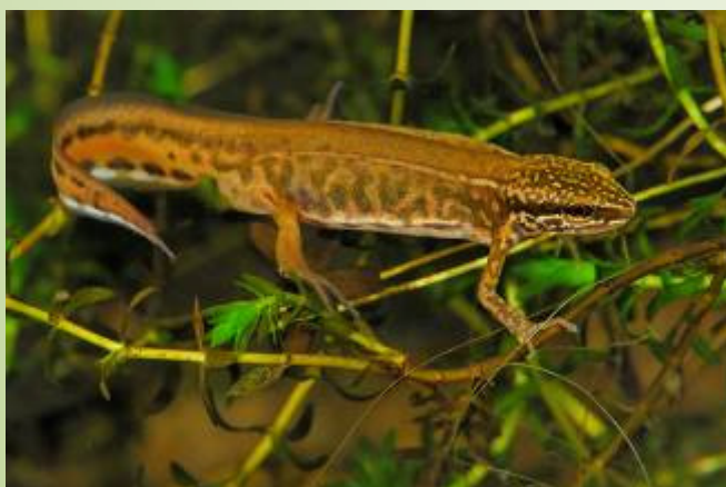
Triton palmé (B. Baudin)