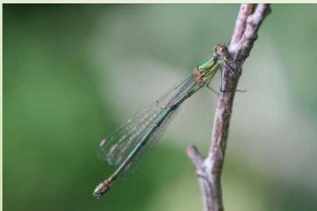
Leste vert (O. Duval)