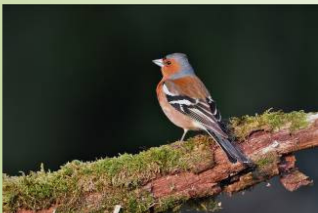
Pinson des arbres (R. Peillon)