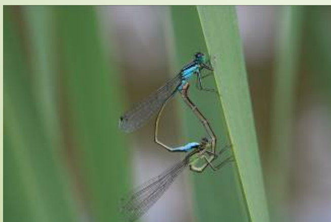
Agrion élégant (O. Duval)