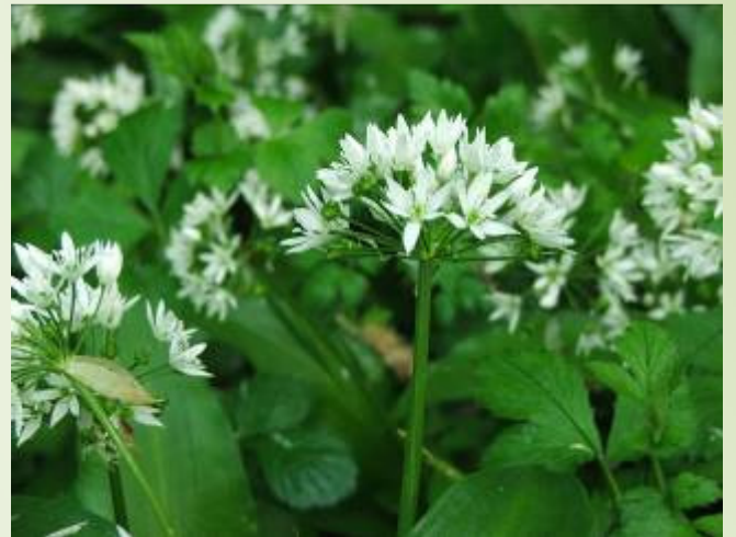
Ail des ours (M. Ravet)

Au printemps, vous pouvez découvrir un immense tapis bleuté de Jacinthes des bois, ainsi qu'une station odorante d'Ails des ours. Les oiseaux forestiers se font entendre tels que le minuscule et discret Roitelet huppé et le Troglodyte mignon.