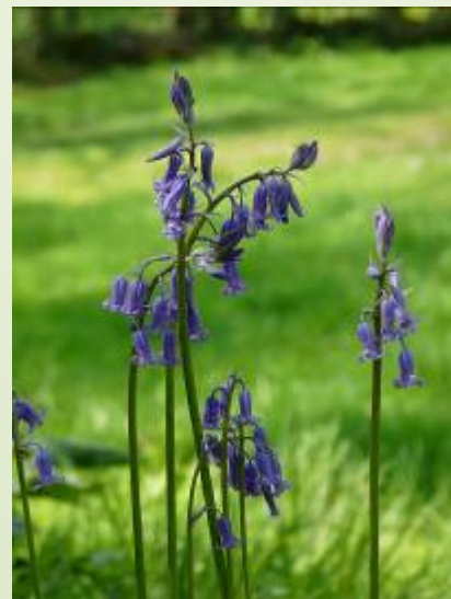
Jacinthe des bois (M. Ravet)

Les écoles de la commune, l'accueil de loisirs et les associations locales fréquentent le site. Des manifestations ont lieu sur le site dans le cadre des journées du Patrimoine ou de la fête de la nature.