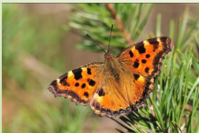
Grande tortue (B. Baudin)