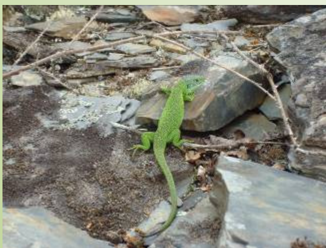
Lézard vert (C. Bouju)