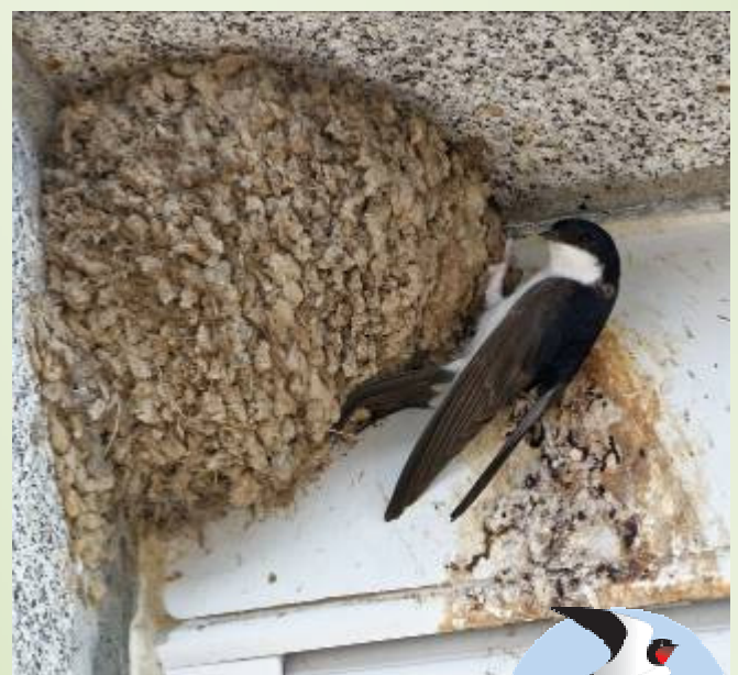
Hirondelle de fenêtre (B. Baudin)