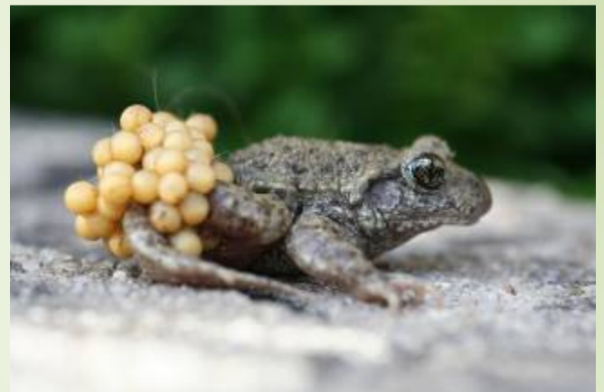
Alyte accoucheur (O. Duval)