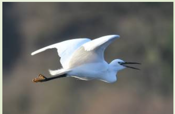
Aigrette garzette (V. Fuchs)

Vous trouverez d'autres informations sur le site internet de MNE http://www.mayennatureenvironnement.fr/le-reseau.html .