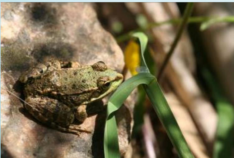
Grenouille verte (O. Duval)