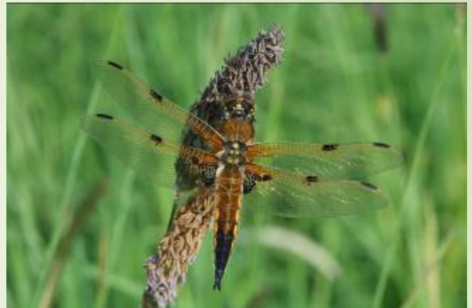
Libellule à quatre tâches (O. Duval)

Grâce à la mairie, de nombreuses sorties pédagogiques permettent aux écoles et collèges de découvrir un environnement préservé. Plusieurs panneaux ont été installés et réalisés par le Syndicat de Bassin de l'Oudon et par MNE, ainsi que 4 hôtels à insectes par le collègue Saint-Joseph.