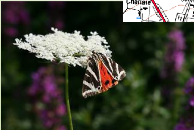
Écaille chinée (O. Duval)