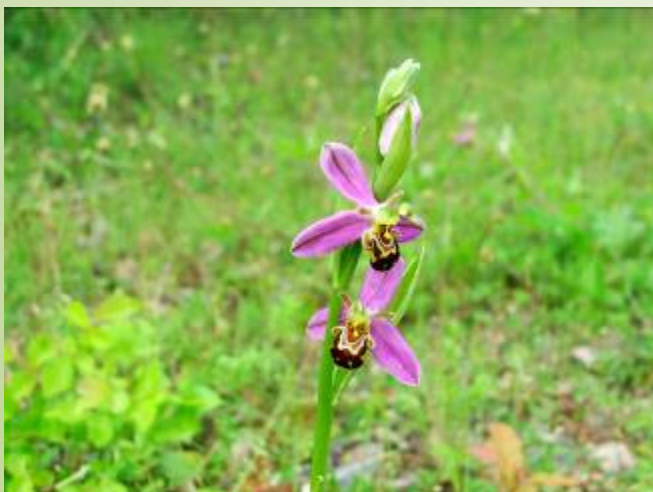
Ophrys abeille (O. Duval)