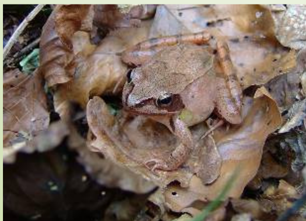
Grenouille agile (O. Duval)