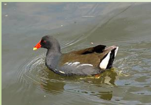
Gallinule poule-d'eau (L. Herriau)