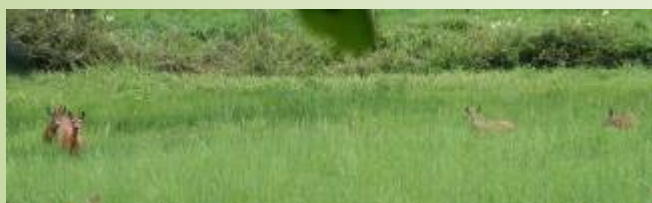
Chevreaux (O. Duval)