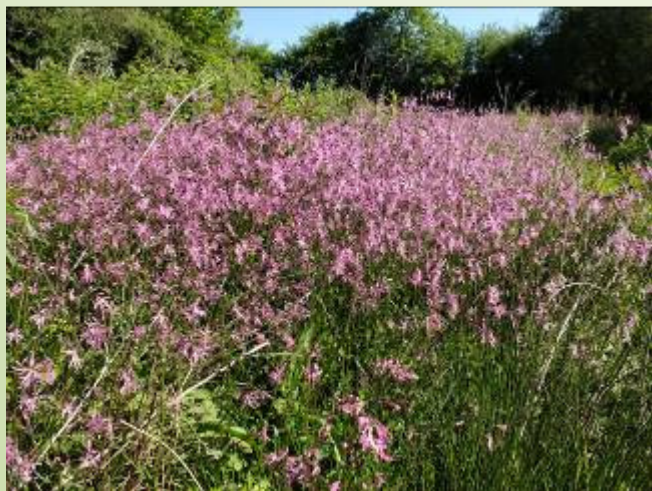
Lychnis fleur-de-coucou (B. Jarri)