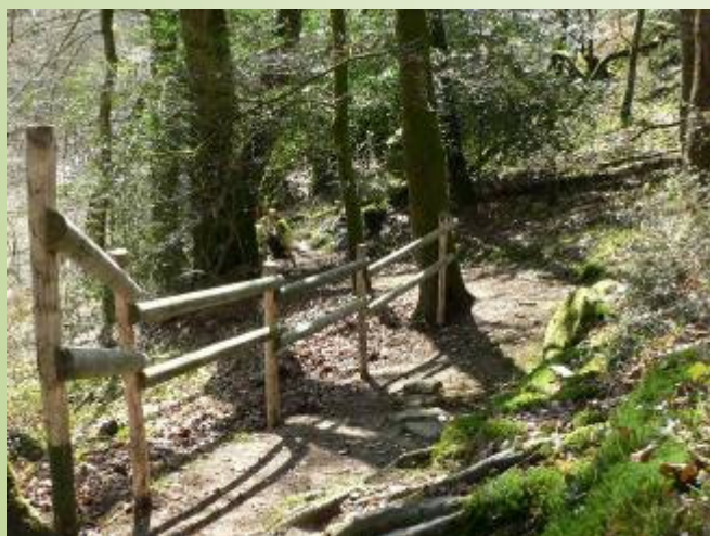
Aménagement (D. Laugaro)

D'une grande diversité floristique, l'époque idéale est le début du printemps avec des tapis de Jacinthes des bois et de stellaires. On raconte qu'il y aurait du Muguet sauvage dans ce sous-bois... Vous longerez une magnifique falaise granitique datée de 540 millions d'années au pied du coteau qui abrite une biodiversité particulière (fougères, cloportes, mille-pattes...).