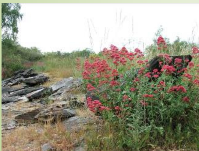
Centranthe rouge (M. Ravet)