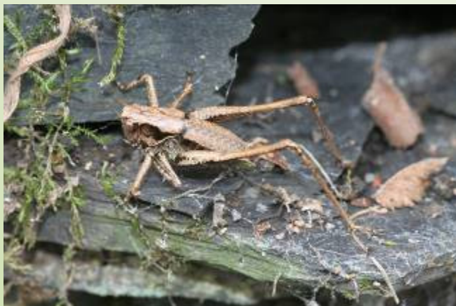
Antaxie (O. Duval)