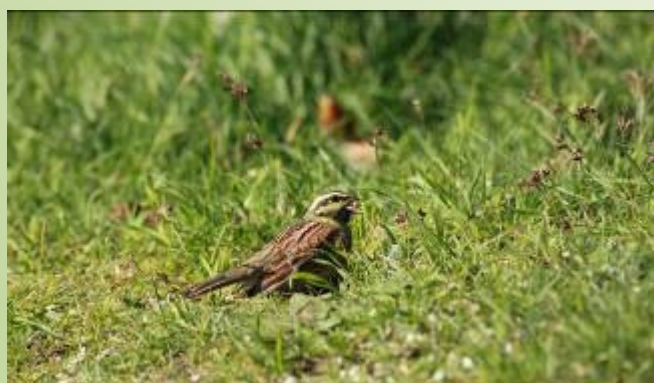
Bruant zizi (B. Foulard)

Toute l'année, la balade offre aux visiteurs des contrastes saisissants en fonction de la météo, de la lumière et des couleurs saisonnières. Dès la fin de l'été, beaucoup d'oiseaux sont observés lors des passages migratoires. Les pieds de talus tapissés de fleurs au printemps sont magnifiques.