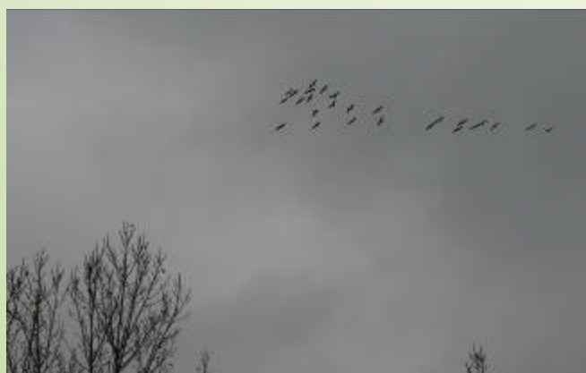
Vol de Grues cendrées (O. Duval)

Après la chapelle, bifurquez sur votre droite et poursuivez votre chemin. Prendre à droite au niveau d'une voie goudronnée sur 170 m jusqu'à une intersection et prendre aussitôt le sentier en face. Arrivé à la départementale 536, prendre à droite pour regagner Saint-Cyr-en-Pail (1 km). Vous passerez devant « l'Épinay ».